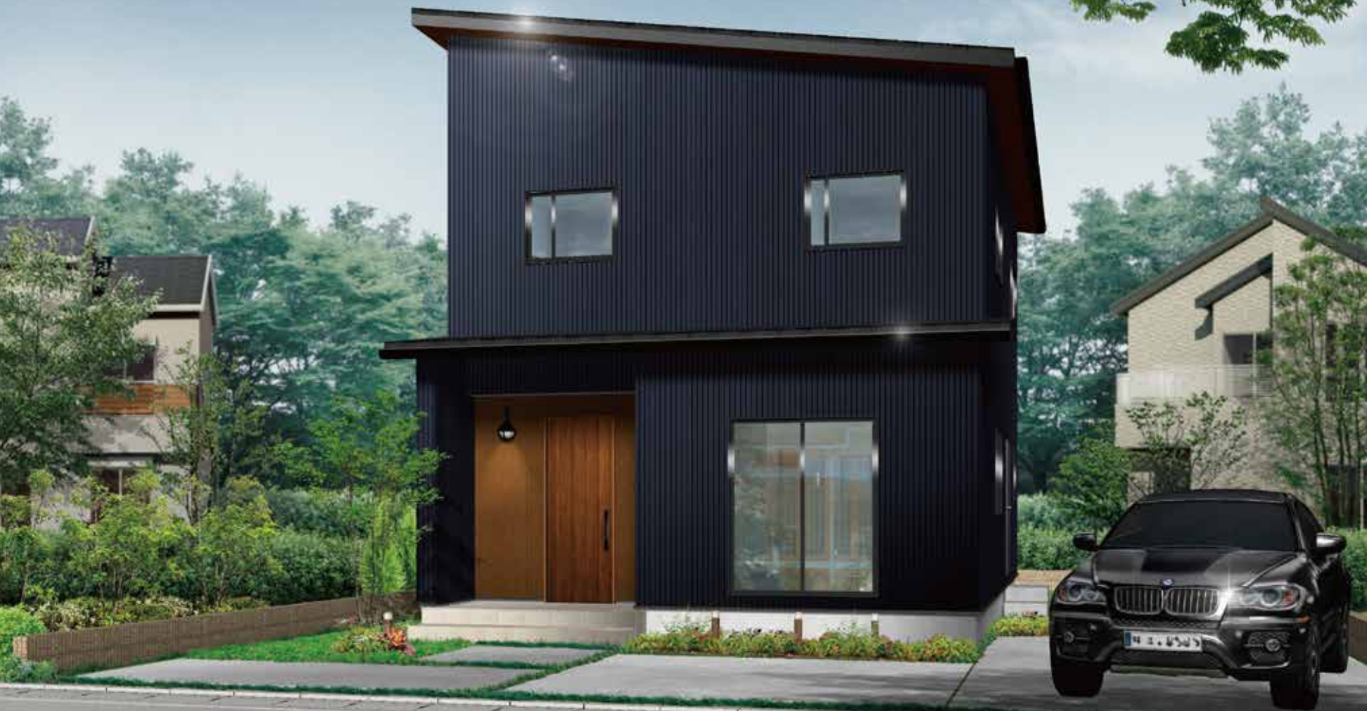
掲載のパーズは図面を基にCGで描いたものです